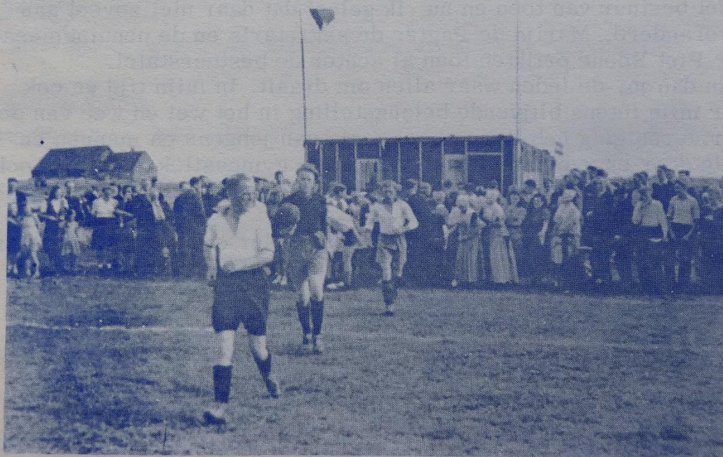
Opening veld Christiaanse 4 september 1948